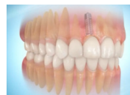
Prothèse dentaire terminée